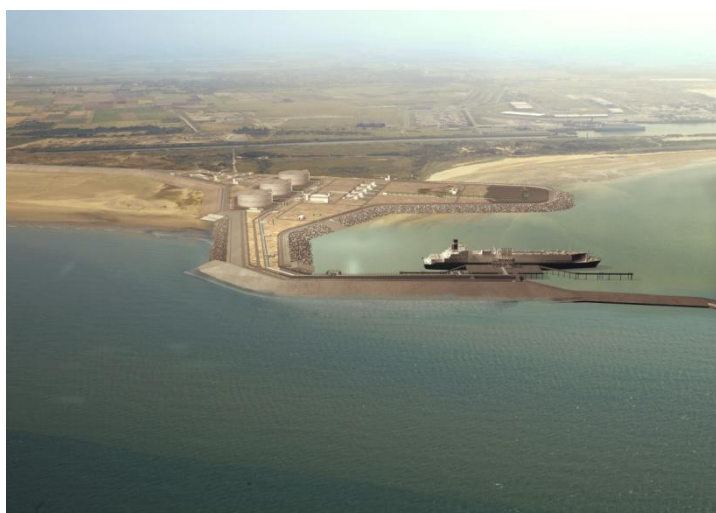
Photomontage de l'implantation du terminal sur le site du Clipon

Trois maîtres d'ouvrage sont associés à ce projet :